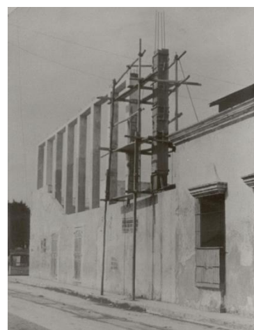
Figura 2 La casa antigua y la nueva estructura

Una de las hipótesis planteadas supone adecuar y aprovechar los muros originalmente levantados, para lo cual, se buscaba construir una estructura metálica ó de concreto armado dos tercios más alta que el edificio original, buscando con ello establecer un punto importante de modernización mejorando la imagen del centro de barrio y dándole un valor agregado a su entorno. Otra de las hipótesis que se plantearon es que si bien, el espacio se encuentra dentro de la zona patrimonial decretada, este no es un edificio patrimonial, si iba a estar en el ánimo y de identidad de los habitantes de la zona, ya que modificaría su entorno original y una última hipótesis es si el uso que se pretende dar al edificio como "Casa de la Música" alteraría el medio ambiente social hasta ahora desarrollado en la zona.