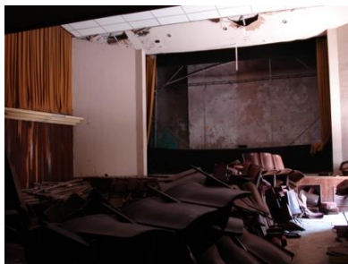
Figura 6 Sala principal de espectadores

Hay pérdida de luminarias y no funciona el equipo de ventilación mecánica ni los aires acondicionados, la pérdida de recubrimiento acústico en las paredes, madera y cortinas, es general. Las cortinas que aún se encuentran en su lugar, están infestadas de microorganismos y parásitos, con rasgaduras y manchas.