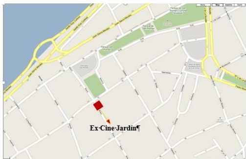
Figura 3 Croquis de la ubicación actual del edificio, en el centro del barrio San Román

El predio se encuentra localizado en la esquina de la Calle Bravo A y la calle 12 del Barrio de San Román.