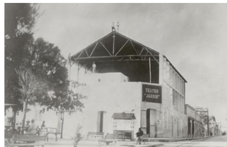
Figura 1 Exterior del teatro jardín en construcción. 1933.

Al terminar completamente la rehabilitación del inmueble, se utilizará para realizar talleres de actualización de los creadores (45 personas) y también en la formación de públicos que les guste esta disciplina de las artes, brindando servicios y formación musical (150 niños y jóvenes músicos).