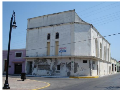
Figura 5 Estado actual del edificio, antes de las intervenciones

Pese a destacar entre el resto de las edificaciones del barrio, el estado que presentaba, por su singularidad estructural y por sus dimensiones, estaba en completo desuso, el inmueble, se encontraba en total abandono, la estructura de concreto armado presenta desprendimientos por la presencia de óxido en refuerzos metálicos de la estructura y desprendimiento de recubrimiento de concreto por la expansión del acero de refuerzo al presentar oxidación. Los muros presentaban pérdida de aplanados y humedades ascendentes y descendentes por capilaridad y escurrimiento en las estructuras. Existe un deterioro general en acabados tanto en pisos, pinturas, muros, muebles de baño, carpintería, herrería, etc., los que constituye una pérdida total de muchos de estos elementos.